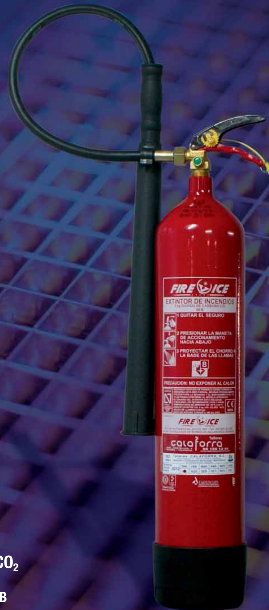
Extintor 5 Kg CO 2 Eficacia: 89B Eficacia exigida: 89B