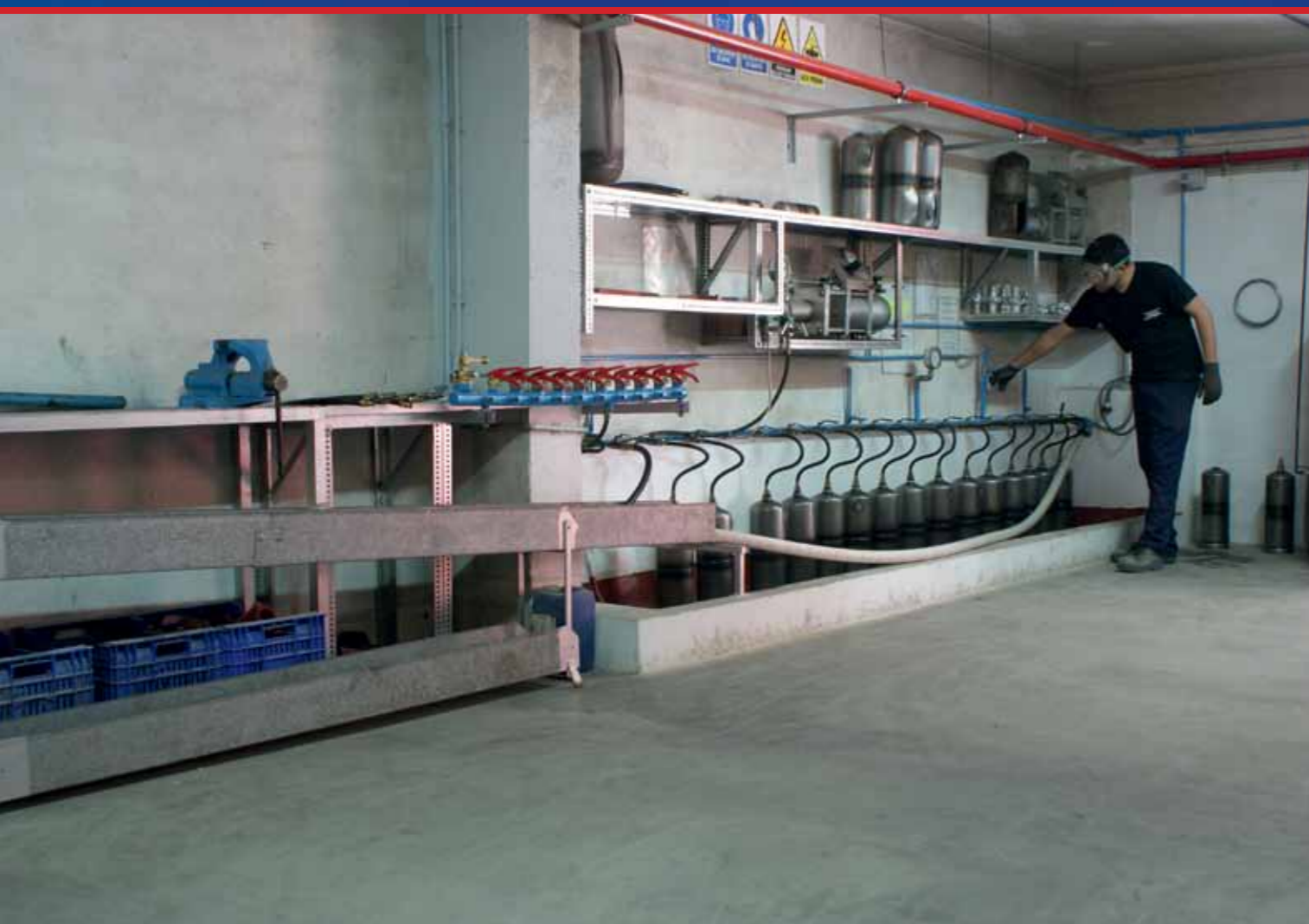
Área de pruebas hidráulicas y retimbrados